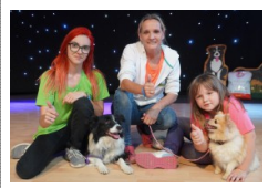
Trickdog-Shows und Dogdancing gab es ebenfalls.