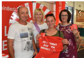
Beim Stand der RegionalMedien konnten die Besucher gewinnen.