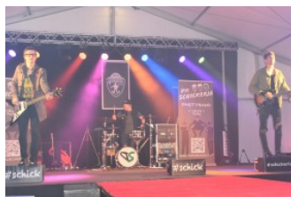
Die Schickeria sorgten für gute und moderne Musik.