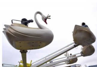
Im Vergnügungspark ging es hoch hinaus.