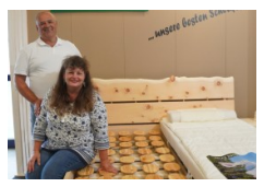
Das Wohn- und Schlafstudio Bieber ist seit vielen Jahren Aussteller.