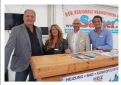
Topberatung gab es u.a. auch bei der Firma Samer.