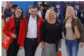
Die RegionalMedien-Mitarbeiter waren auch bei der Inform on Tour.