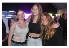
Die Jugend traf sich vor allem am Wochenende.