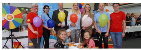
Für die Familien und Kinder bot der „Family Corner“ jede Menge Beratung und Abwechslung.