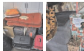
Geld- und Sachspenden sowie leckere Hundekexse.