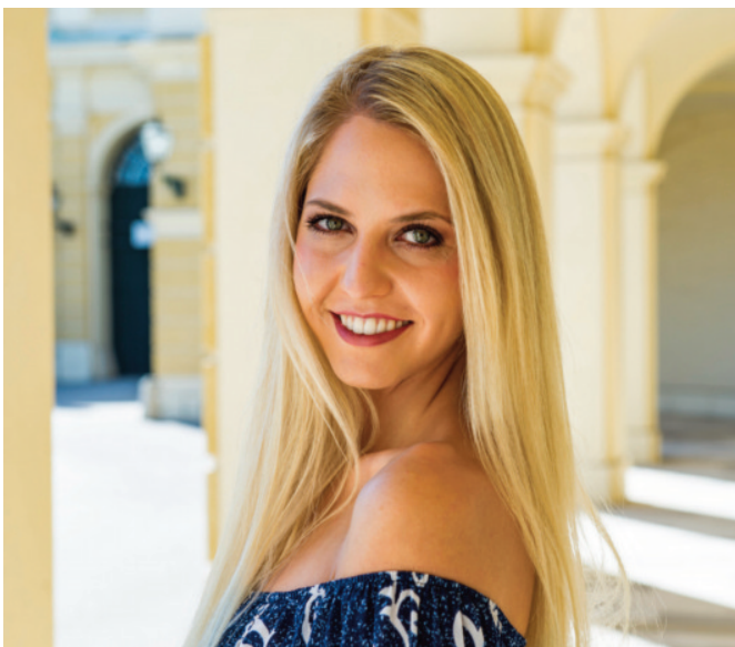
Miss Europe 2021, Beatrice Körner, verwendet die Produkte