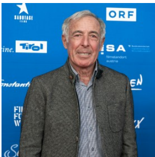
Ski-Superstar aus Italien am Red Carpet: Gustav Thöni