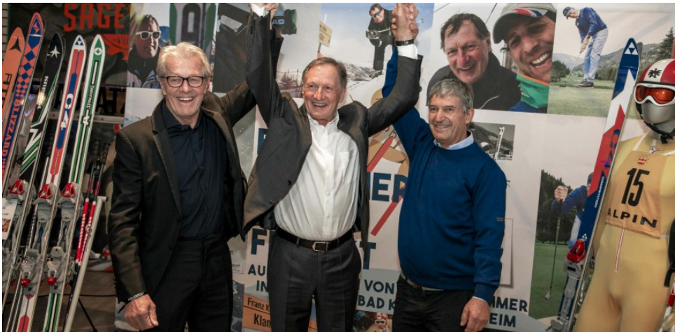
So sehen die Sieger von 1976 aus: Erstmals wieder vereint, die drei Erstplatzierten von Innsbruck Bernhard Russi, Franz Klammer und Herbert Plank.